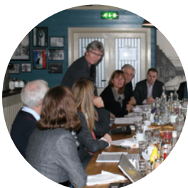
Dialogmøte om kunnskap og innovasjon Side 3