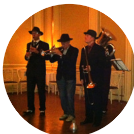
Nettverks- og næringsråds- samling Side 3