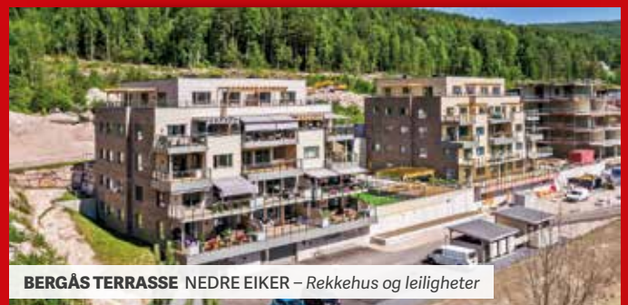
BERGÅS TERRASSE NEDRE EIKER – Rekkehus og leiligheter