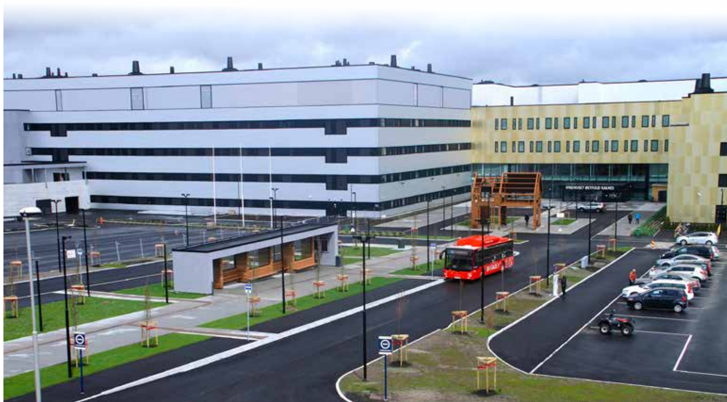
NYTT OG TRÅDLØST: Sykehuset Østfold Kalnes var det første sykehuset i Norge som valgte løsninger for pasientovervåking gjennom det trådløse nettet.