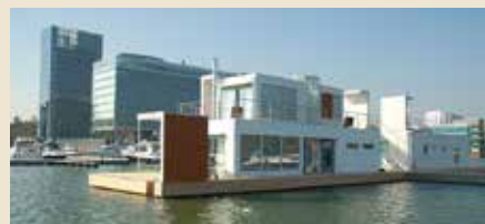
ENEBOLIG TIL VANN: Det finske selskapet Marina Housing ser for seg slike eneboliger på vann.