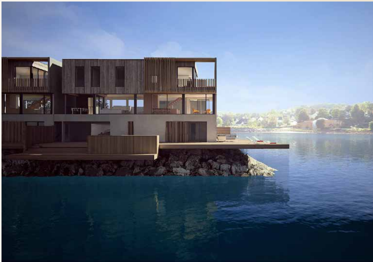
15 MILLIONER: Utbyggerne har valgt å utnytte beliggenheten ved fjorden helt maksimalt. 12 slike eneboliger i Havseilervegen, på den kunstige øya, ble nylig lagt ut for salg til en snittpris på 15 millioner. 500 potensielle kjøpere meldte seg. Illustrasjon: Bennett.