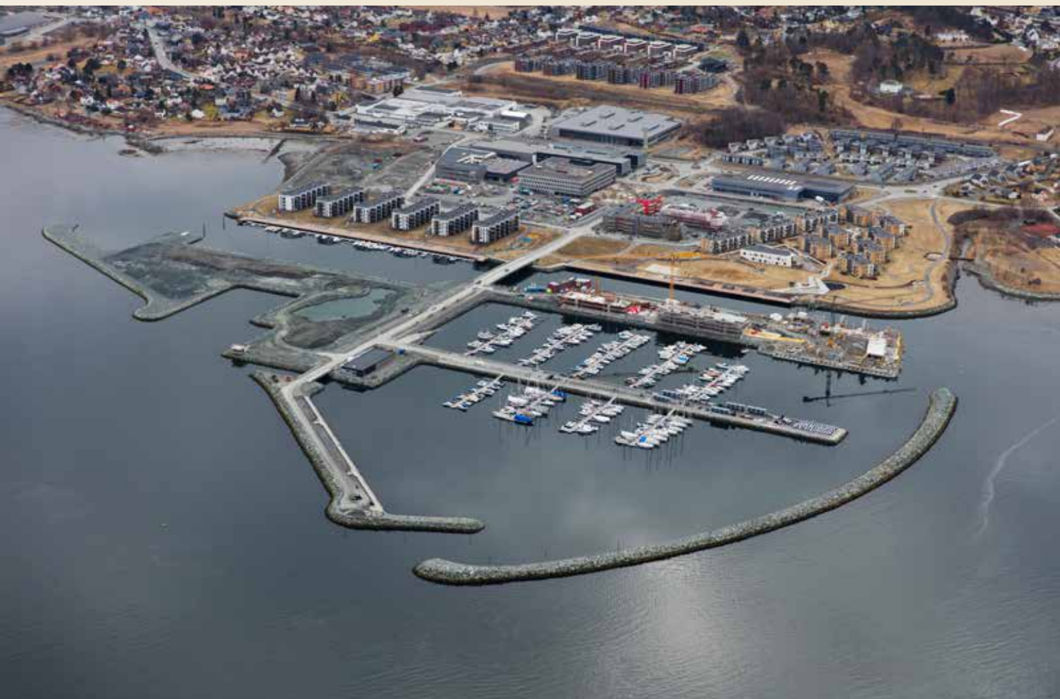
2014. Illustrasjon/flyfoto: Bennet/Erling Skjervold

etableringene. I tillegg er marinaen ferdig utbygget, og store deler av uteområdene og en utvidet tursti er på plass, forteller administrerende direktør i Grilstad Marina, Liv Malvik.