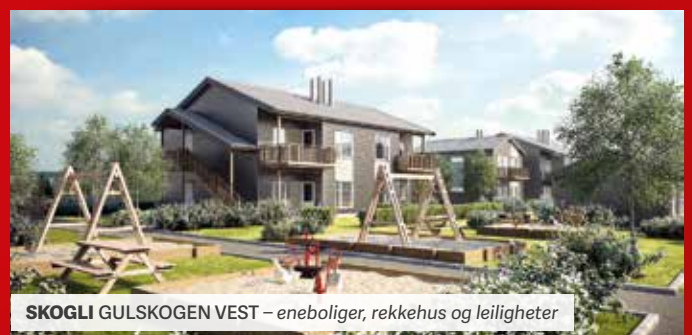
SKOGLI GULSKOGEN VEST – eneboliger, rekkehus og leiligheter