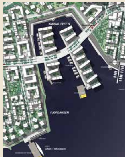
FLYTENDE ØY: Det kan være aktuelt med flytende boligøyer i den nye Fjordbyen, slik som illustrert her i Gilhusbukta. Illustrasjon: JuuL Frost Arkitekter

– Dette er en milepel i prosjektet. Nå kan vi komme i gang med den formelle planprosessen, og det er også gledelig at Lier kommune ønsker at vi skal stå for utarbeiding av planene, sier Finnerud. 24