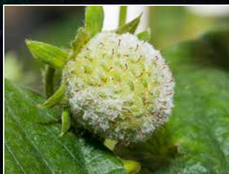
SOPP: Soppen meldugg ødelegger store avlinger jordbær.