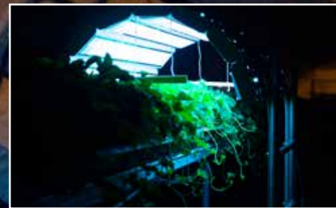
NATTLYS: Roboten kjører lys over jordbærplantene på egenhånd om natten.