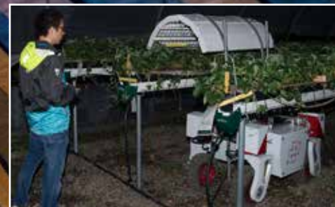
ROBOT: En masterstudent ved NMBU kontrollerer lys-roboten.