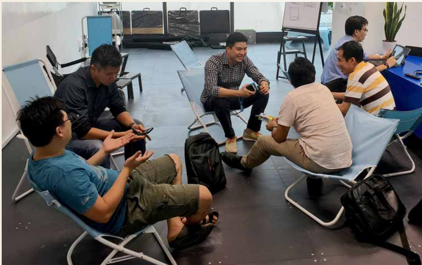
MALAYSIA: CXS har etablert seg i hovedstaden Kuala Lumpur i Malaysia der de så langt har investert 12 millioner kroner sammen med malaysiske myndigheter.