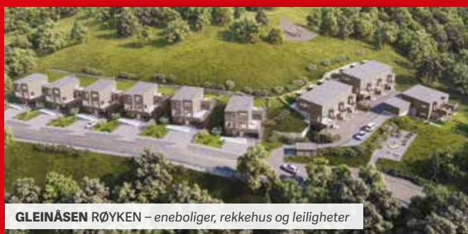
GLEINÅSEN RØYKEN – eneboliger, rekkehus og leiligheter