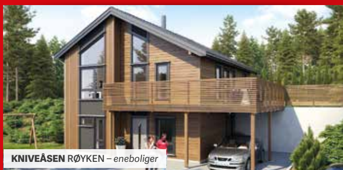
KNIVEÅSEN RØYKEN – eneboliger