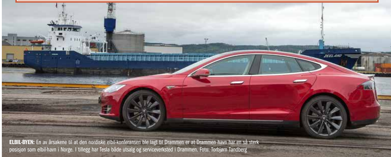
ELBIL-BYEN: En av årsakene til at den nordiske elbil-konferansen ble lagt til Drammen er at Drammen havn har en så sterk posisjon som elbil-havn i Norge. I tillegg har Tesla både utsalg og serviceverksted i Drammen.