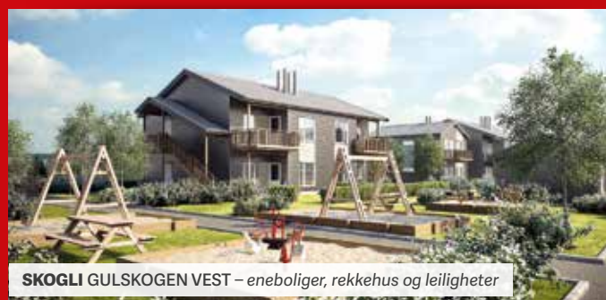
SKOGLI GULSKOGEN VEST – eneboliger, rekkehus og leiligheter