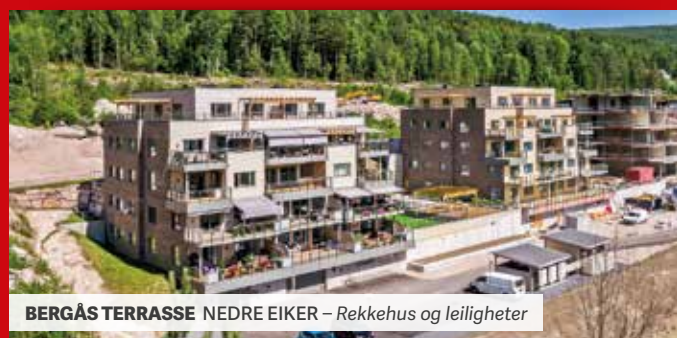
BERGÅS TERRASSE NEDRE EIKER – Rekkehus og leiligheter